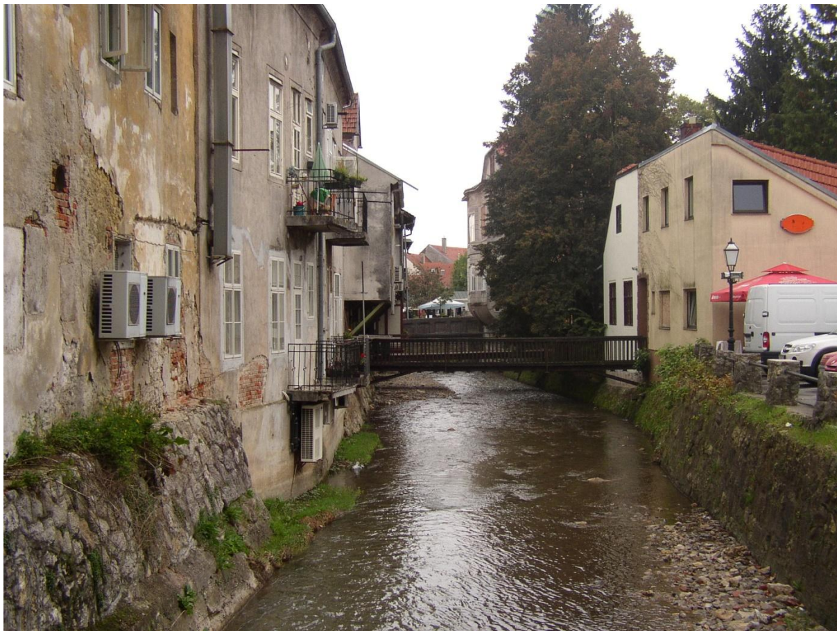
Šteta uz potok Gradina – poznat kao „mala Venecija“ zbog brojnih mostova